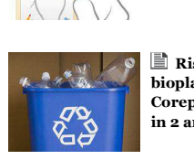
Risorse per le bioplastiche, da Corepla 3 mln di euro in 2 anni