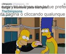
Homer e Marge non divorziano, parola di Bart