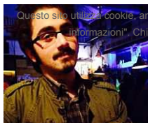
'Volò giù mentre gli amici lo tenevano'. A 'Chi l'ha visto' spunta