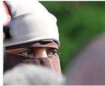
Rifiuta sesso estremo con jihadista, ragazza bruciata viva dall'Is