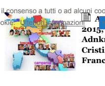
Adnkronos Live 2015, speciale Adnkronos - A cura di Cristiana Deledda e Francesco Saita