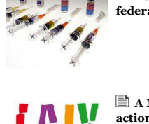
La 'coda' dell'influenza stagionale: strategie per il prossimo anno