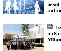
Native advertising & marketing automation: i due asset per fare business online