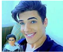
Addio al Ken umano, il modello brasiliano che amava le bambole /Foto