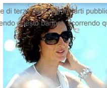
Renzi difende la moglie Agnese: "Prendetevela con me non con lei"