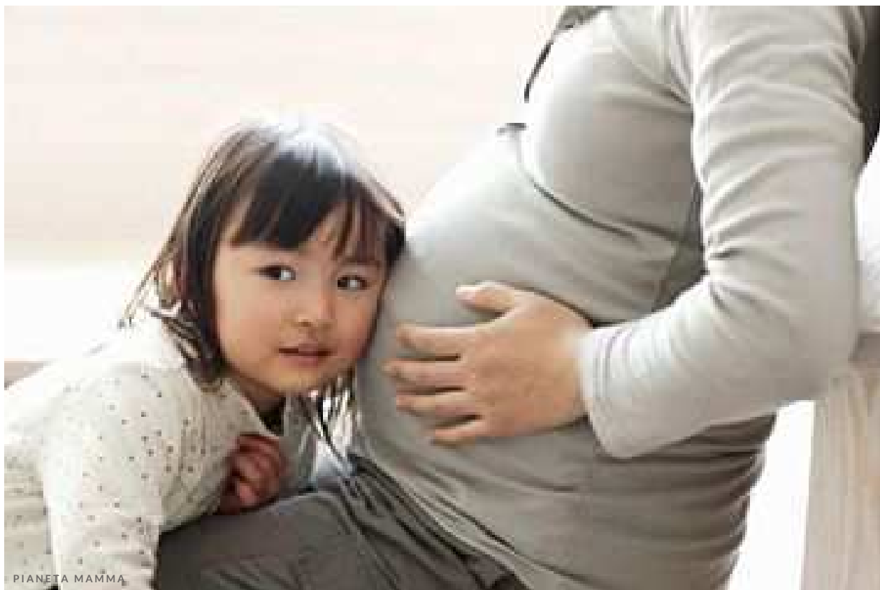
35 trentacinquesima settimana di gravidanza