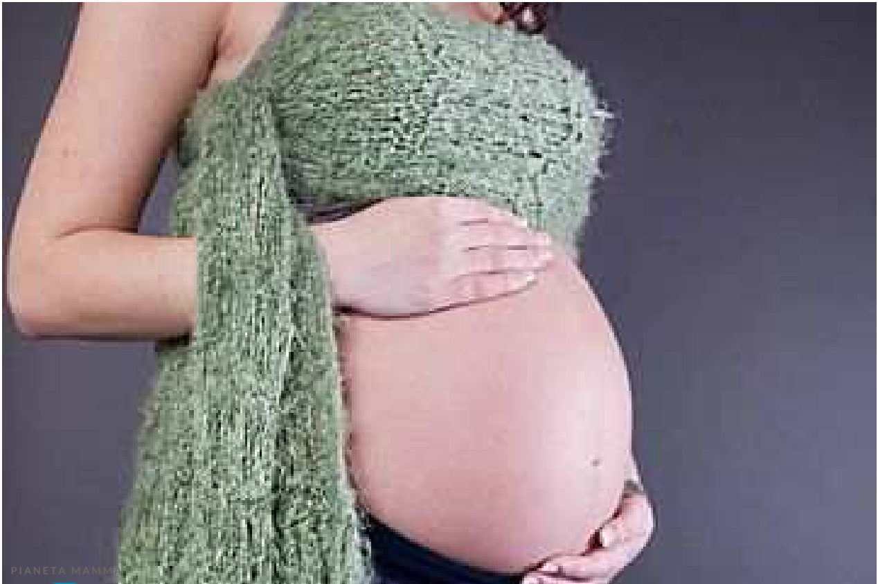
Depilazione 'intima' in vista del parto